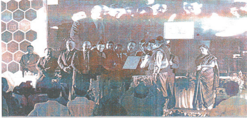
राजस्थान सरकार के अधिकारीगण महाराष्ट्र के मुख्यमंत्री श्री देवेन्द्र फडनवीस से राष्ट्रीय ई-गवर्नेन्स का स्वर्ण पुरस्कार प्राप्त करते हुए।