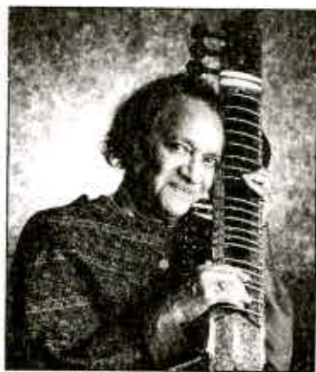
ਚਿੱਤਰ-(2) ਪੰਡਿਤ ਰਵੀਸ਼ੰਕਰ

ਆਧੁਨਿਕ ਕਾਲ ਦੇ ਸੁਪ੍ਰਸਿੱਧ ਵਾਦਕ ਸਿਰਫ ਭਾਰਤ ਵਿੱਚ ਹੀ ਨਹੀਂ ਸਗੋਂ ਸਾਰੇ ਵਿਸ਼ਵ ਭਰ ਵਿੱਚ ਇਹਨਾਂ ਦੀ ਪ੍ਰਤਿਭਾ ਨੂੰ ਮੰਨਿਆ ਜਾਂਦਾ ਹੈ। ਆਪਣੀ ਕਲਾਤਮਕ ਪ੍ਰਤਿਭਾ ਦੇ ਦਮ ਤੇ ਪੰਡਿਤ ਜੀ ਨੇ ਭਾਰਤੀ ਸਾਜ਼ ਸਿਤਾਰ ਨੂੰ ਵਿਦੇਸ਼ਾਂ ਵਿੱਚ ਵੀ ਪ੍ਰਸਿੱਧੀ ਦਿਲਵਾਈ।