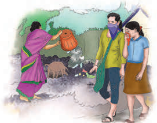
रस्त्यावर कचरा टाकणारी महिला

या चित्रांमध्ये कोणत्या कर्तव्यांचे पालन होत नाही असे तुम्हांला वाटते ?