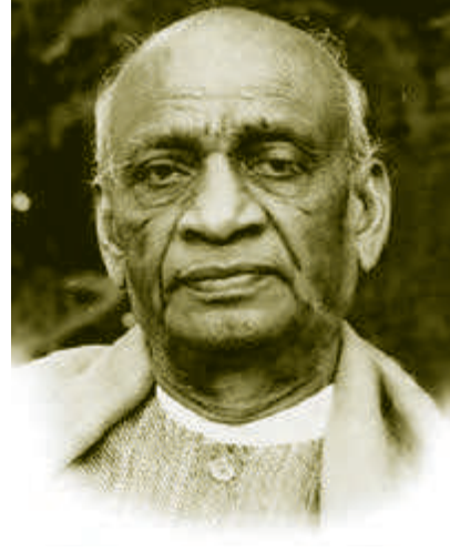
सरदार वल्लभभाई पटेल