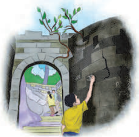
वास्तूवर नाव टाकणारा मुलगा