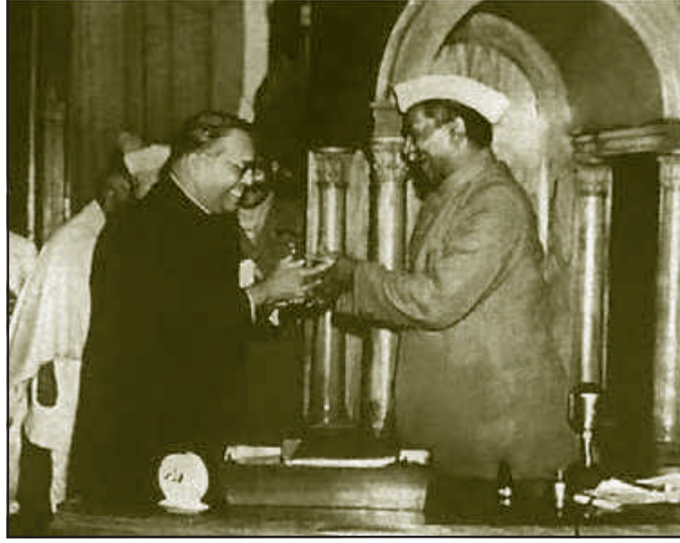
भारतीय संविधानाचा मसुदा संविधान सभेचे अध्यक्ष डॉ.राजेंद्रप्रसाद यांना सादर करताना डॉ.बाबासाहेब आंबेडकर