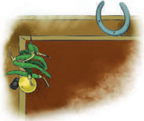
लिंबू, मिरची लटकवलेले