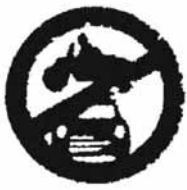
सभी मोटर वाहन निषेध