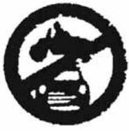
सभी मोटर वाहन निषेध